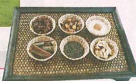
以各種香料製成的按摩及浸浴產品。

新鮮果物 去角質一流 飲飽喝醉，是時候探索酒店的消閒設施了。這裏除擁有全三亞最大的泳池，五星級酒店必備的水療中心當然不缺，設於酒店大堂的一側的「泉」水療中心，擁有自家的私人空間，不受其他住客往來滋擾，環境顯得特別清幽。這裏共設有八間獨立按摩室，悉數備有私人按摩浴池，來一個這裏最馳名的蜂蜜芒果去角質護理（約500港幣），材料全用當地出產的新鮮水果及蜂蜜製成，在肌膚中塗抹按摩，雖只是短短的三十分鐘，已足以叫人身心煥發，皮膚更見幼滑。 酒店更為客人備妥不少免費活動，包括網球、羽毛球，以及每天早上及黃昏各辦一次的瑜伽班，天氣好時，導師更會將上課地點由健身中心移至海邊旁的青草地，在藍天下伸展筋骨，吸收自然之氣，特別覺得醒神。若一大群朋友來玩，也可一起玩沙灘排球，或跳跳舞，或往遊戲天地打保齡、玩桌球及各種先進電子遊戲等，盡情偷閒一番，只是各種水上活動如滑浪、划艇、潛水及釣魚等，則要待至7月後才可陸續進行，大家只好靜心等待了。