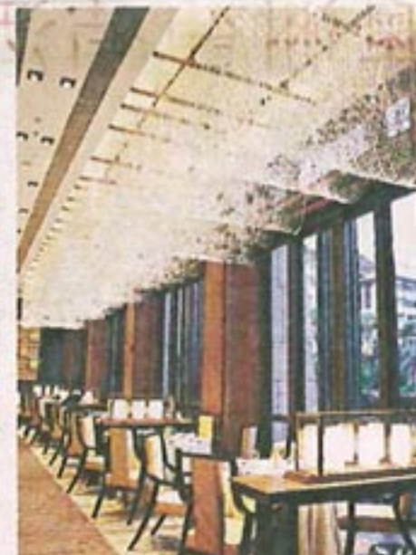
中餐廳苗香庭設計豪華時尚。