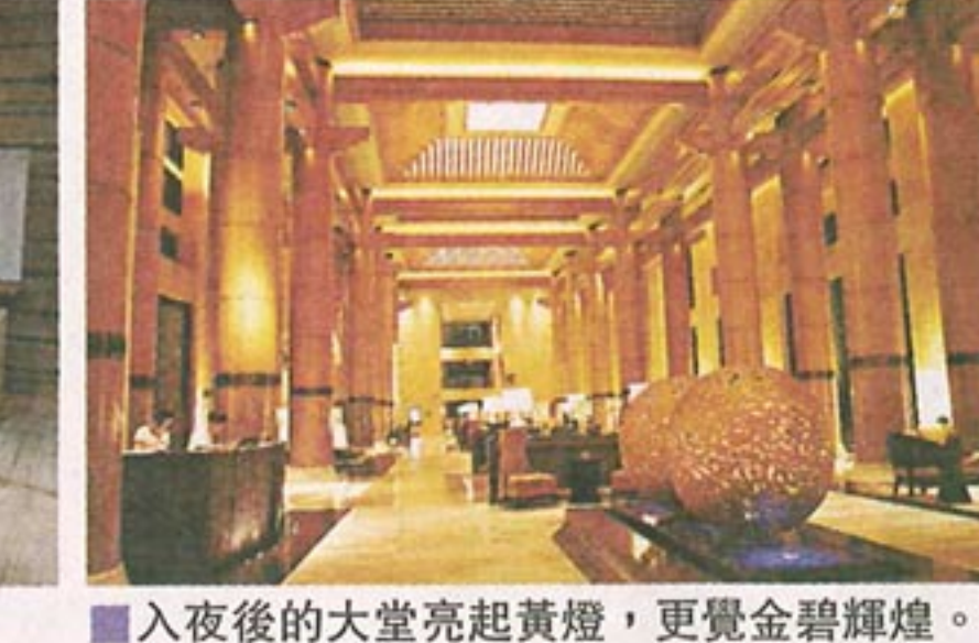
入夜後的大堂亮起黃燈，更覺金碧輝煌。

Info 三亞萬麗度假酒店 地址：海南省三亞市海棠灣椰州路一號 電話：86 898 3885 8888 網頁：www.cn.renaissancesanya.com