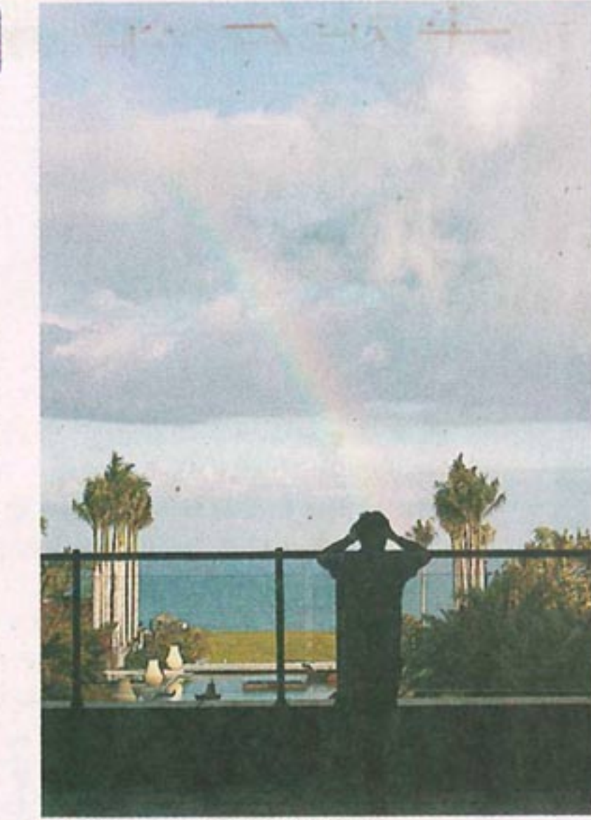
酒店上空忽現雨後彩虹。