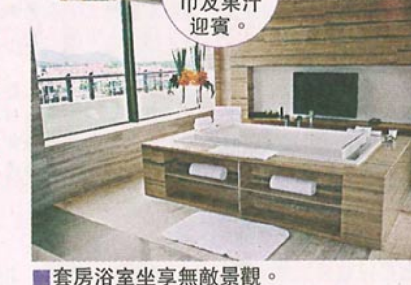
套房浴室坐享無敵景觀。

超豪華房 擁私家泳池 海南島三亞有多紅？據說全長約八公里的亞龍灣畔，短短數年之內，已被多家國際五星級酒店佔領，猶如群雄割據，本是清幽的海邊，現在卻已熱鬧非常，幸而海南島四面環海，美麗海灘多不勝數，亞龍灣被攻陷了，還有另一側的海棠灣，面對南中國海無敵景觀，大型酒店暫時只有兩家，最新進駐的是今年3月才全新開業的三亞萬麗度假酒店（Renaissance Sanya Resort & Spa），獨佔灣畔一側，猶如私人王國。 由三亞國際機場乘專車約四十分鐘，即可抵達酒店，下車那一刻，涼風迎面襲來，在這攝氏三十多度的高溫下，確叫人暑氣大消，原來酒店大堂因應環保不設空調，但通空設計，加上特高樓底，把海風都引來了，確比冷氣效果更好，此時還有專人送來冰涼毛巾及特色冷飲降溫，服務極為周到。 穿過華麗大理石酒店大堂，便是採園林設計的綠草地，以及全三亞最大的連貫式私人泳池，據說暢遊一周需時約二十分鐘，有興趣者大可挑戰一下個人體力。至於酒店的五百零七間豪華客房，則分佔數幢環繞園林而建的建築，超過八成客房更有海景，由於地方大，這裏的標準客房已有約六百平方呎，配以露台，以及LCD大電視、無線及有線高速上網及iPod等先進齊備的設施，足以媲美香港的小豪宅。 若想像家歡一回，更何妨多付一點入住兩房泳池別墅，甚至是萬麗套房，全擁私人泳池之餘，其中萬麗套房更只有兩間，佔據酒店大樓兩側的七樓之上，佔地超過三千平方呎，獨擁視野廣闊的無敵大海景，更在兩側露台各設一個私人泳池及按摩浴池，讓客們可隨時享盡暢泳樂趣，自由自在，不受打擾。據酒店經理介紹，萬麗套房設計較傳統套房更時尚，特別適合年輕有品味的人士入住呢！