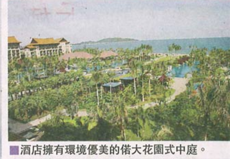
酒店擁有環境優美的偌大花園式中庭。