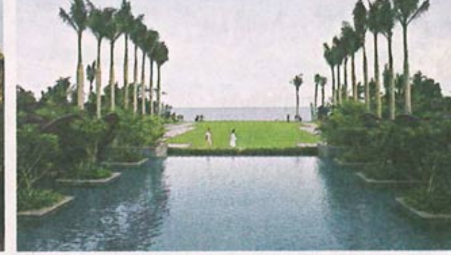
酒店於海棠灣畔，擁有美麗的南中國海景色。