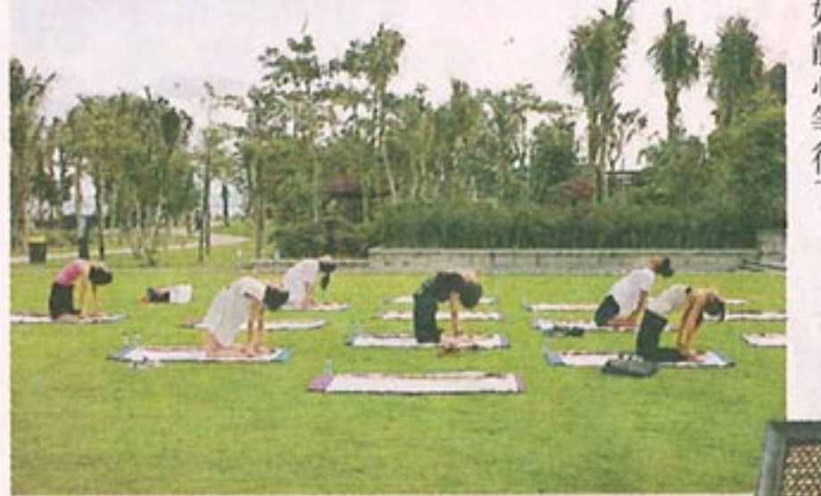
在藍天下做瑜伽，感覺特別醒神。

新鮮果物 去角質一流 飲飽喝醉，是時候探索酒店的消閒設施了。這裏除擁有全三亞最大的泳池，五星級酒店必備的水療中心當然不缺，設於酒店大堂的一側的「泉」水療中心，擁有自家的私人空間，不受其他住客往來滋擾，環境顯得特別清幽。這裏共設有八間獨立按摩室，悉數備有私人按摩浴池，來一個這裏最馳名的蜂蜜芒果去角質護理（約500港幣），材料全用當地出產的新鮮水果及蜂蜜製成，在肌膚中塗抹按摩，雖只是短短的三十分鐘，已足以叫人身心煥發，皮膚更見幼滑。 酒店更為客人備妥不少免費活動，包括網球、羽毛球，以及每天早上及黃昏各辦一次的瑜伽班，天氣好時，導師更會將上課地點由健身中心移至海邊旁的青草地，在藍天下伸展筋骨，吸收自然之氣，特別覺得醒神。若一大群朋友來玩，也可一起玩沙灘排球，或跳跳舞，或往遊戲天地打保齡、玩桌球及各種先進電子遊戲等，盡情偷閒一番，只是各種水上活動如滑浪、划艇、潛水及釣魚等，則要待至7月後才可陸續進行，大家只好靜心等待了。