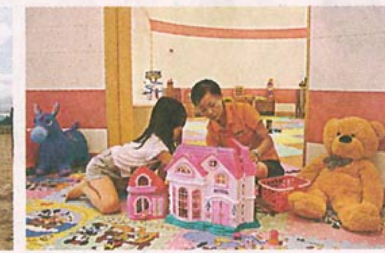
小朋友可到兒童樂園玩耍。