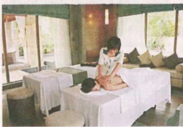
水療中心設有八間獨立按摩室。